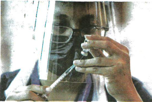
JANGKITAN baharu atau berulung berlaku disebabkan subvarian baharu berkenaan dapat mengelak sistem imun yang telah dibina melalui vaksin atau jangkitan Covid-19 terdahulu.

vaksin atau jangkitan Covid-19 terdahulu. Justeru, walaupun kelonggaran diberikan, masyarakat masih perlu mengambil langkah pencegahan jangkitan Covid-19, yang antara lain termasuklah memakai pelitup muka.