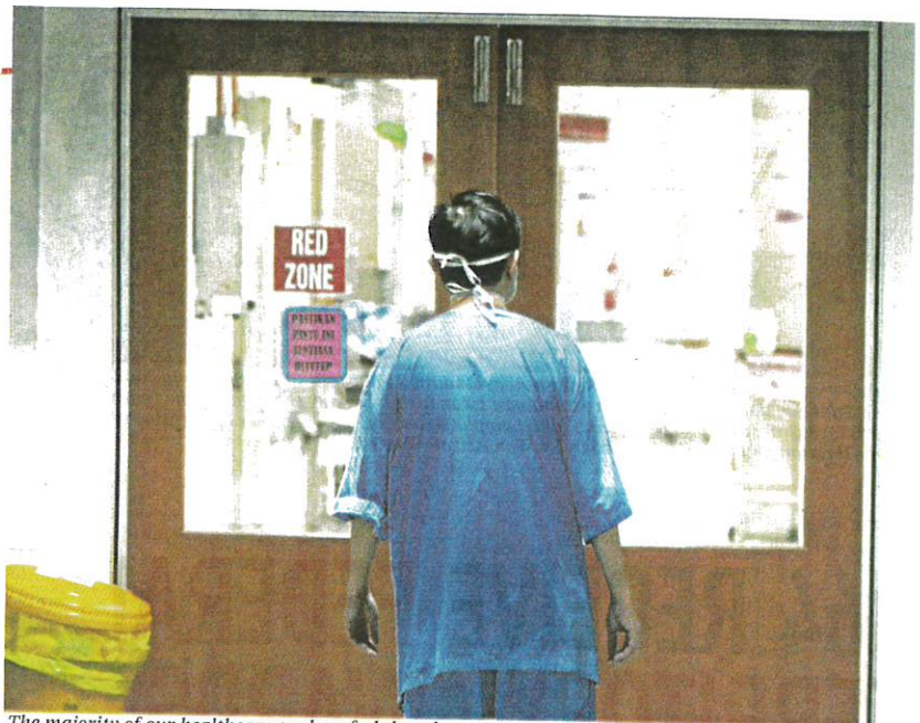
The majority of our healthcare workers feel that the country's public health system is in a crisis. FILE PIC

Most of the respondents, up to 77 per cent, are serving at the Health Ministry's hospitals, 16 per cent at government health clinics and five per cent at uni-