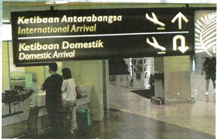
SEMPADAN negara yang kini dibuka kepada pelancong asing, dikhuatiri meningkatkan risiko jangkitan varian baharu.

Katanya Universiti Malaya menubuhkan UMVOICE ( Universiti Malaya Vaccine Communication Collaborative Effort ) sebagai badan penelaras bagi meningkatkan kesedaran umum untuk mengambil vaksin. Ia juga sebagai platform rujukan masyarakat untuk maklumat yang sahih dan mudah dicapai.